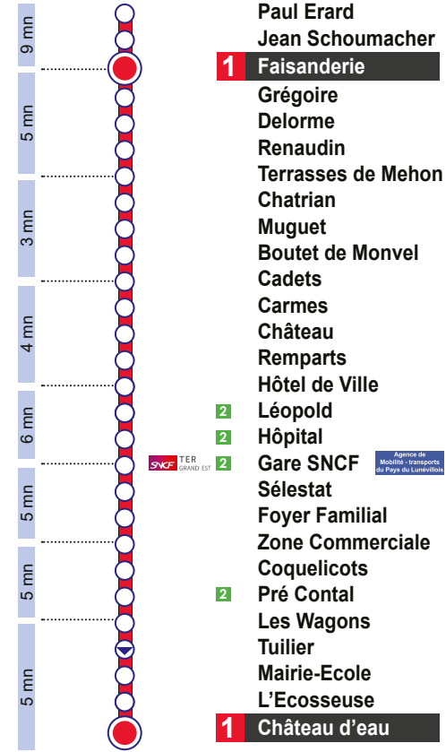
Schéma de ligne